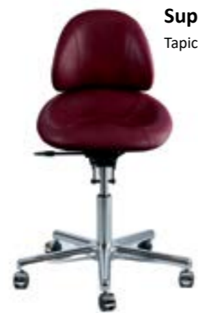
Support Tapicerka skórzana