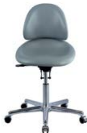
Support Tapicerka winylowa