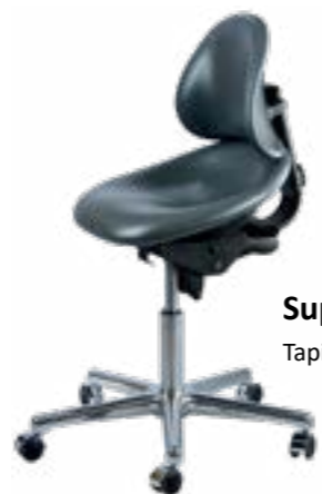
Support Tapicerka winylowa Stern Weber