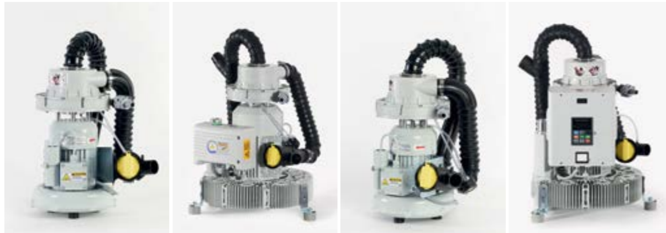
EXCOM hybrid 1s