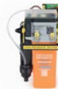
MULTI SYSTEM TYP 1 ECO LIGHT