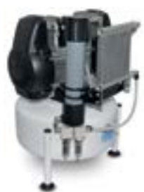
24/10 GENESI M