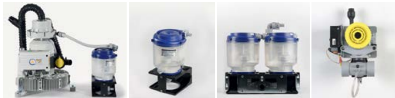
EXCOM hybrid 1 + ECO II