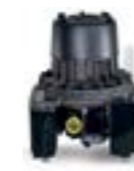
VS 300 S