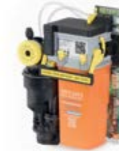
MULTI SYSTEM TYP 1 (MST 1)