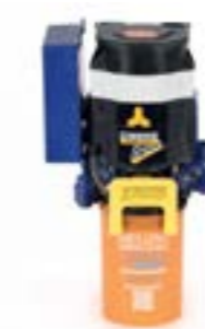
COMPACT ECO DYNAMIC