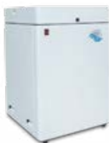
MINI BOX 24/10 GENESI M