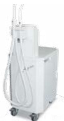
DO M (Aspina)